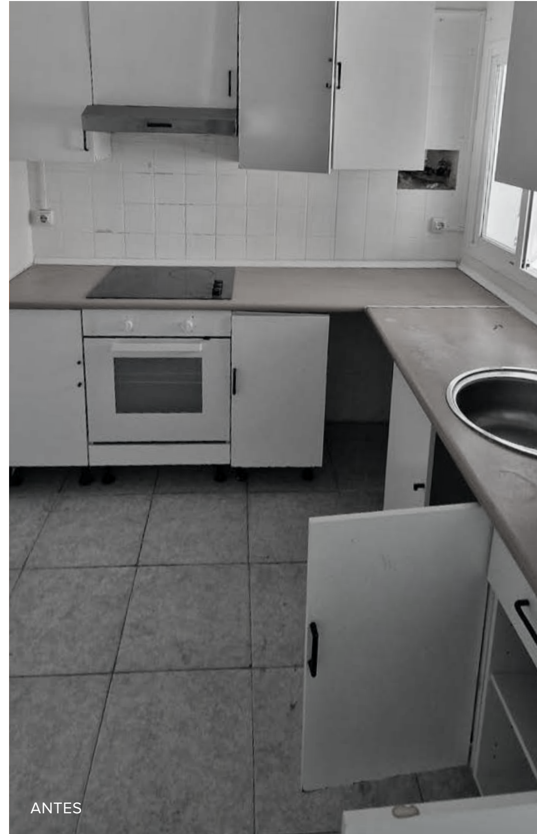
Registro Fotográfico Piso Caja Mágica Previo a Renovación / Post Renovación