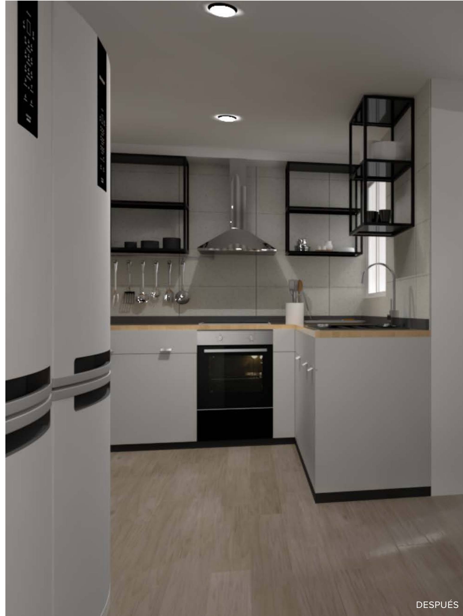
CAJA MÁGICA ZONA USERA , MADRID